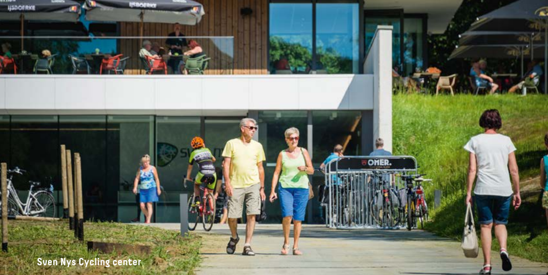
Sven Nys Cycling center